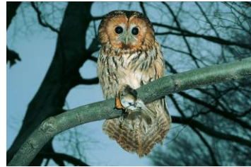
Pressebild 3: Waldkauz