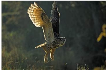
Pressebild 5: Uhu