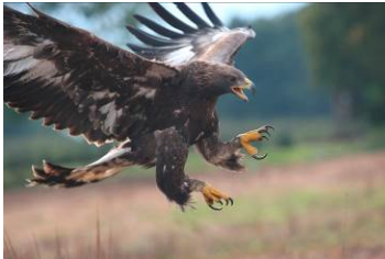
Pressebild 1: Steinadler