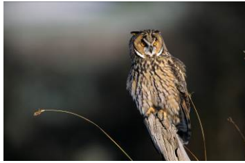
Pressebild 2: Waldohreule