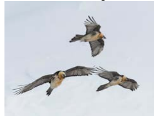
Pressebild 6: Bartgeier